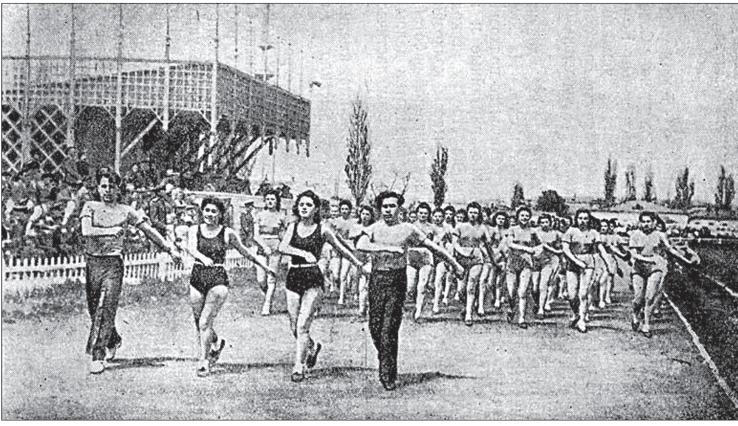
Парад молодежи на стадионе «Динамо» (до постройки западной трибуны).