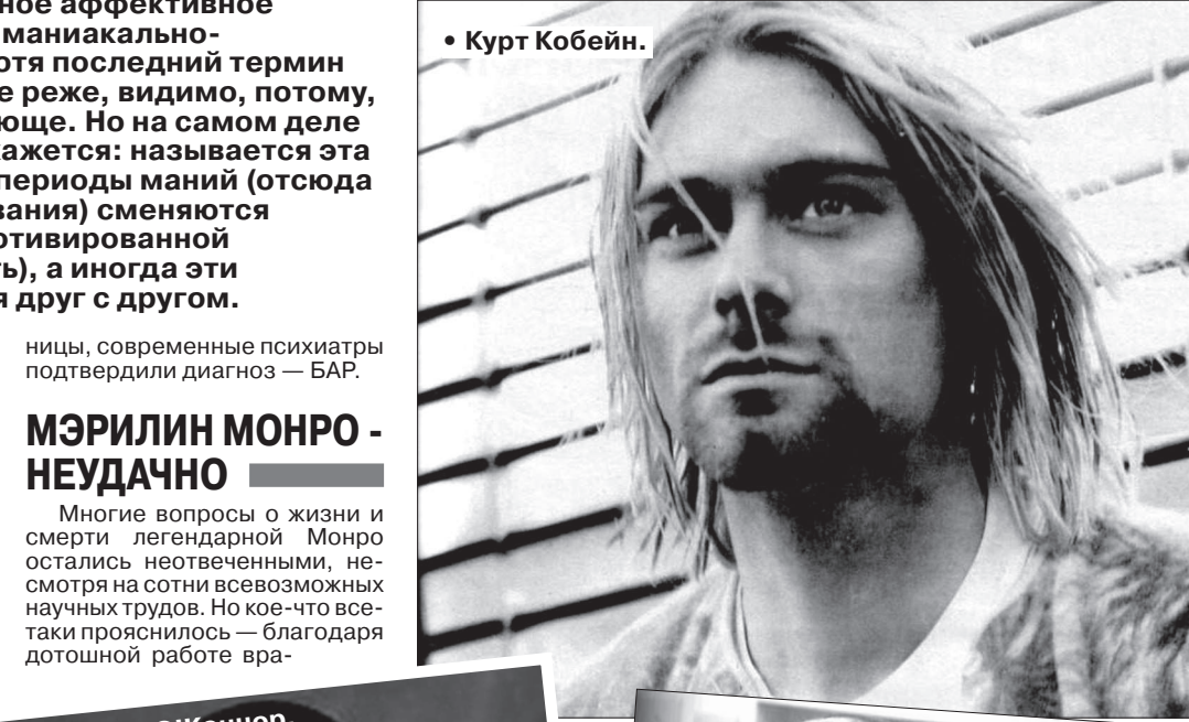
• Курт Кобейн.

Яркий пример «депрессивного маньяка». Ван Гог яростно творил в период маний и впадал в «творческий анабиоз» во время депрессии. БАР в его случае осложнялось тем, что художник всю жизнь страдал из-за своей внешности, и даже знаменитый эпизод с отрезанным ухом биографы связывают именно с этим. По легенде, Ван Гог как-то спросил одну проститутку: «Тебе хоть что-нибудь во мне нравится?» — и та, подумав, ответила, что ей нравится его уши. Чем закончилась история, можно догадаться. Жизнь великого художника завершилась не менее печально. Последний год жизни он провел в психиатрической лечебнице, где и совершил самоубийство, выстрелив себе в грудь.