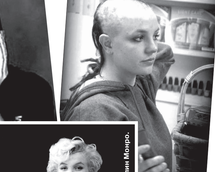
• Мэрилин Монро.

совершенства и заставляла творить, но в то же время именно болезнь в конечном счете его и убила.