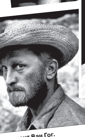
• Винсент Ван Гог.