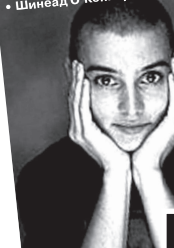
• Шинеад О'Коннор.