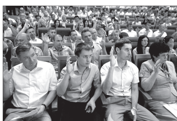
• Делегаты конференции одобрили итоги выполнения коллективного договора.

в регионах присутствия подразделений Общества. В целях охраны особо охраняемых природных территорий совместно с Бештаугорским лесхозом высажены тысячи кустарниковых саженцев на южном склоне горы Кинжал в регионе КМВ. В рамках акции «Сохраним природу» проводились субботники, расчищались русла рек, восстанавливались и благоустроивались источники питьевого водоснабжения, устанавливались кормушки для птиц. Всего в первом полугодии на охрану окружающей среды потрачено более 15 млн рублей. Достигнутые результаты — вклад всего коллектива Общества.