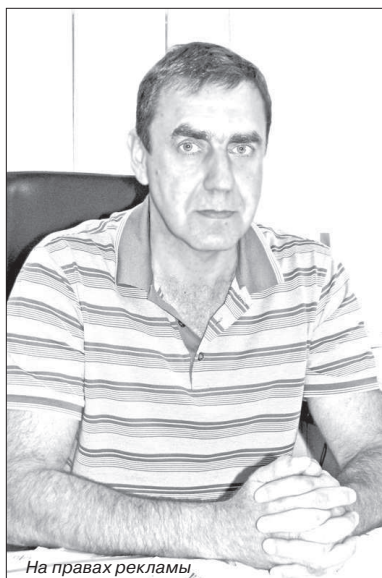
На правах рекламы.

ВТБ приступил к кредитованию крупнейшего сельскохозяйственного предприятия региона - СПК «Казьминский»