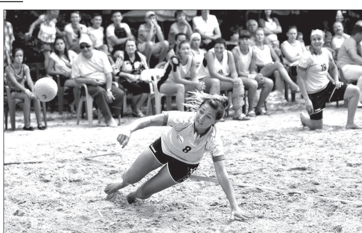
СДЮСШОР», местное «Динамо-ВКОР» и «Энергия» из Воронежа. С. ВИЗЕ.

в Волгограде с 9 по 15 сентября. Их соперницами станут прошлогодние победители «Сокол» из Брянска, «Ярославна», санкт-петербургская «Кировчанка-