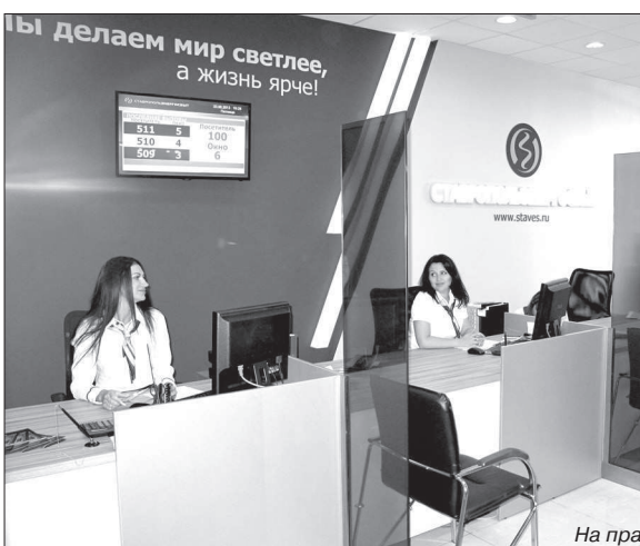
Внимательный персонал ответит на все вопросы.

В составе компании семь отделений в Ессентуках (в том числе головной офис), в Ставрополе, Георгиевске, Буденновске, Изобильном, Светлограде, а также 33 участка во всех районах края. ОАО «Ставропольэнергосбыт» осуществляет энергоснабжение практически 90% территории Ставрополя.