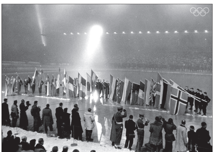
Церемония закрытия Олимпиады.

На проведение Белой Олимпиады претендовали также американский Лейк-Плэсид и итальянский Кортина-д'Ампеццо. Это была первая Олимпиада, место проведения которой определили голосованием членов МОК, а не путем совещания.