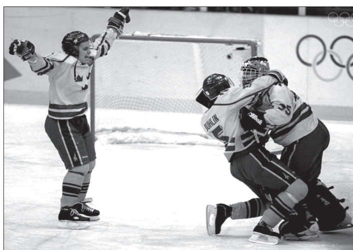
Шведы впервые стали чемпионами.