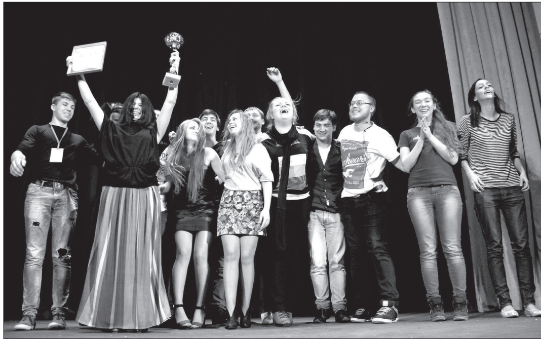
Актеры театральной студии «Мы» (Ставрополь) вручили приз победителям - театру «Пикник на обочине» из Ростова-на-Дону.

В СТАВРОПОЛЕ ЗАВЕРШИЛСЯ ВСЕРОССИЙСКИЙ ФЕСТИВАЛЬ МОЛОДЕЖНЫХ ТЕАТРОВ «ФЕНИКС»