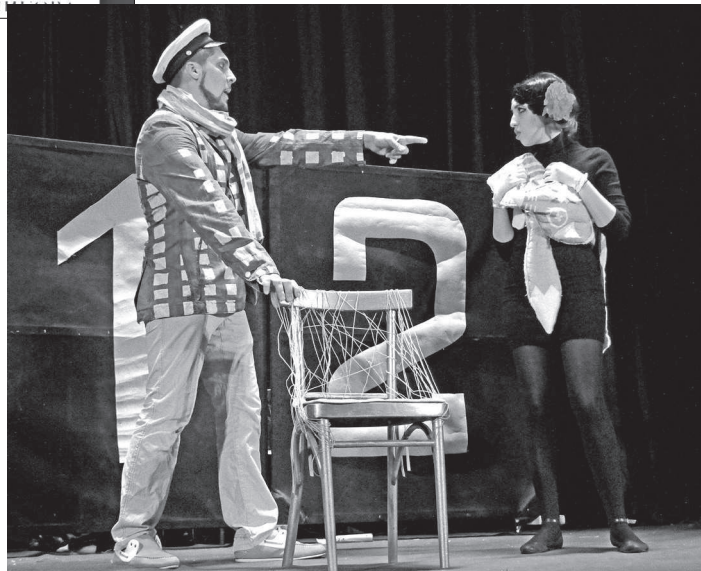
Сцена из спектакля «Великий комбинатор».