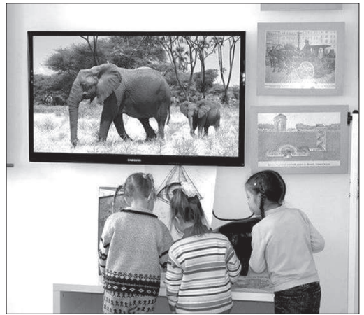
Ци можно будет сфотографироваться на память с символом праздника - ростовой куклой Слоном Фантиком.

Он откроется в зале палеонтологии рассказом о находке скелетов ископаемых южных слонов - Архипа и Нюси, прославивших Ставрополь. Наглядный экскурс в эволюцию хоботных животных завершится игровым квестом-бройликом «Дедушки и внуки южного слона». Игра объединяет два музейных проекта: «Ставрополье - родина слонов» и «Вода из реки Лимпопо», ставших победителями V и VIII грантовых конкурсов «Меняющийся музей в меняющемся мире». Малышам музейщики предложат сложить слоновьи пазлы из дерева, а ребятам постарше картинку-скелет Архипа из 200 фрагментов. Гости музея смогут посмотреть уникальные фильмы о раскопках Нюси, видеоролики «Слоны в природе» и «Слоны в искусстве». По тради-