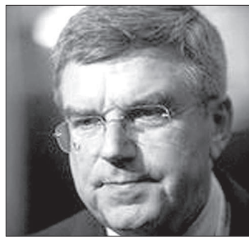
По материалам информационных агентств и корр. «СП».

граммы МОК - полное искоренение запрещенных препаратов в спорте. И мы уверены, что добьемся результатов в этом направлении в ближайшее время». Бах подтвердил, что сейчас при помощи новых методов исследуются замороженные пробы участников Олимпиады-2006 в Турине. И если в этих анализах будут найдены стероиды, то МОК примет решение относительно уличенных спортсменов в соответствии со своей политической нулевой терпимости в отношении допинга.