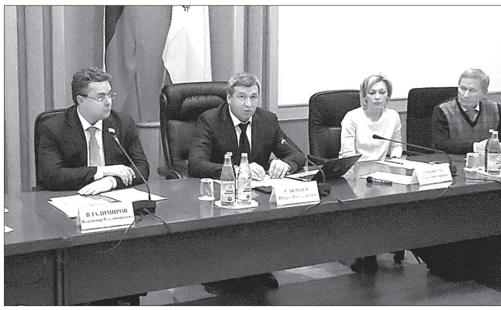
● На совещании в Ессентуках И. Слюняев (в центре) акцентировал внимание на приоритетности вопросов повышения качества жизненной среды.