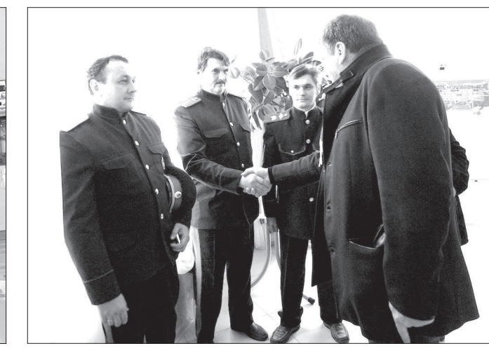
Игорь Слюняев отметил, что на Ставрополе сформирована профессиональная управленческая команда, состоящая из единомышленников. Он пожелал региону высоких социально-экономических результатов в 2014 году.