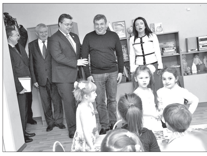
● Встреча с воспитанниками детского сада № 15 в Ставрополе и представителями семиреченских казаков.