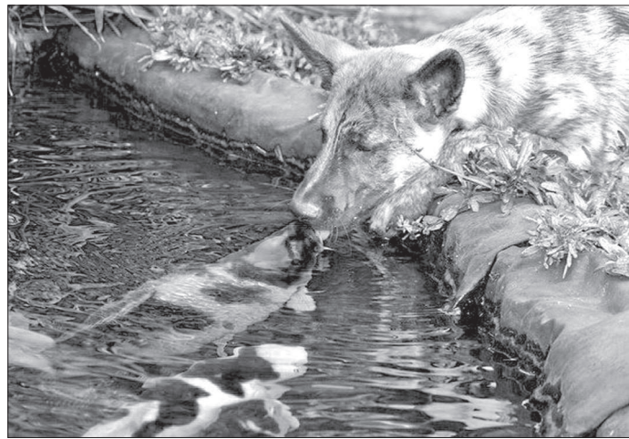
• Собака и рыба. Они, если честно, не пара...

Одесса: - Яша, на могилку чаще тебе приходи.