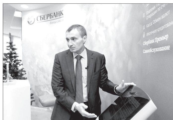
● Высокое качество и скорость обслуживания остаются главными приоритетами в работе банка.

Вместе с тем в преддверии грядущих зимних Олимпийских игр буквально на днях стартовала новая промоакция**, участником которой получить шанс стать обладателями квартиры в Сочи или выиграть один из трех тысяч олимпийских призов. Для этого необходимо в период с 15 января по 15 марта оформить в Сбербанк потребительский кредит и зарегистрироваться в акции, отправив СМС с текстом СБ или СВ и номером кредитного договора на короткий номер 1227. Сомнений в том, что эта инициатива также будет интересна клиентам, практически нет, подчеркнул В. Новиков. Прошлый год отметились повышенным спросом населения региона на банковские займы. И предположительно к тому, что тренд может коренным образом измениться, пока нет. Причем надо отметить, что наряду с потре-