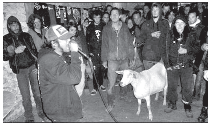
В Мориак. На снимках коза запечатлена рядом с музыкантами. Представительница фермы рассказала, что Бикетт регулярно посещала подобные мероприятия по собственной воле.