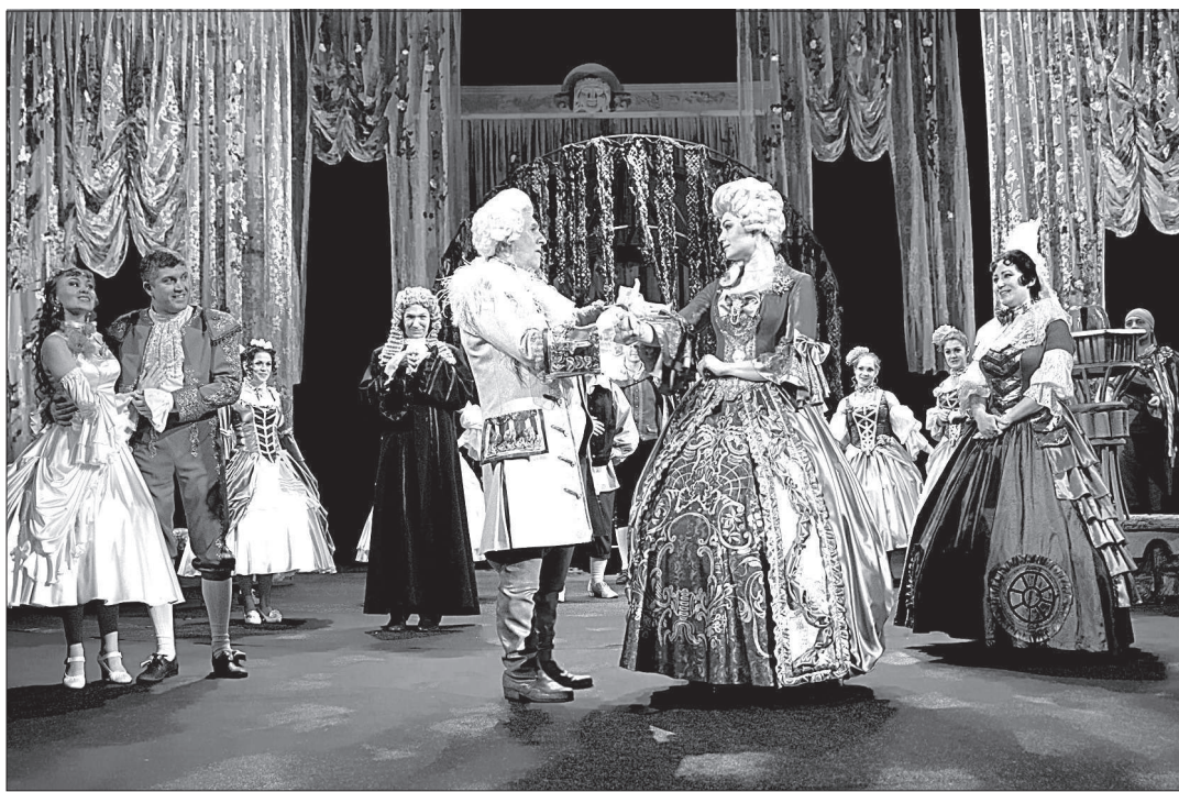
● На снимках: сцены из недавней премьеры - спектакля «Фигаро».

Еще вспомнить сегодняшнее печальное распространение так называемой огромности, станет понятно, что те гоголевские герои, увы, не ушли в прошлое. К тому же гениальный классик, словно предвидя интерес потомков, облек действие в головоломный детективный сюжет, в центре которого – шулеры высочайшей квалификации, авантюристы, чья главная цель – «обмануть всех и не быть обманутыми самими»... Не забудем также не подражаемый гоголевский юмор с его, казалось бы, не сочетаемым сочетанием очаровательной внешней легкости и глубокой пронзительной сатиры. Нет, вовсе не случайно к этой комедии обращались многие знаменитые режиссеры, из наших со-