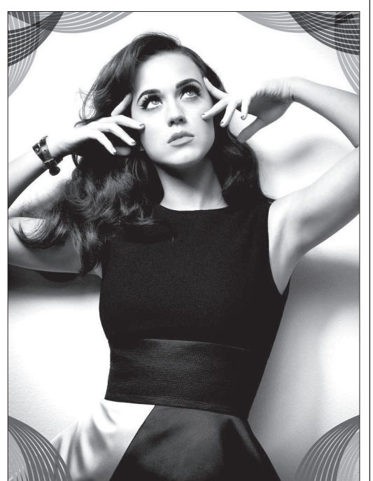
● Непредсказуемая Katy Perry.

Список выступающих на церемонии также впечатляет: непредаваемая Katy Perry, дуэт певицы Pink и солиста группы FUN – Nate Ruess, Nile Rodgers, Robin Thicke и Chicago, рэпер Kendrick Lamar с альтернативщиками Imagine Dragons, а также дебютантка GRAMMY-2014 новозеландская певица Lorde.