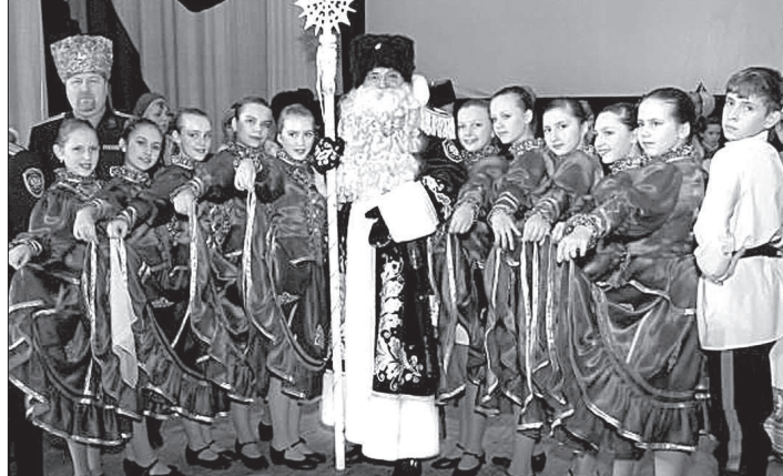
Фото православного молодежного движения «Соборяне».