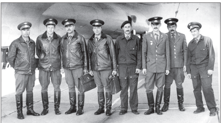
полк (в/ч 06965) взял курс на Кабул.