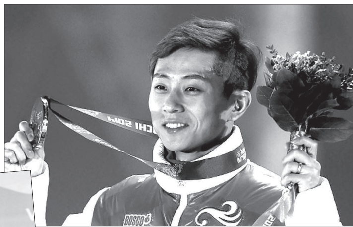
• Виктор АН.