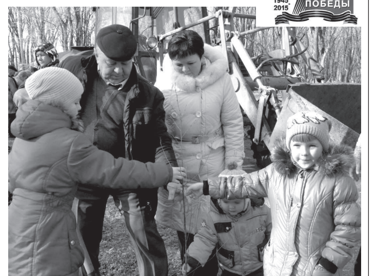
леи Славы - это дань памяти погибшим и умершим воинам Великой Отечественной войны, а также живущим сегодня ветера-