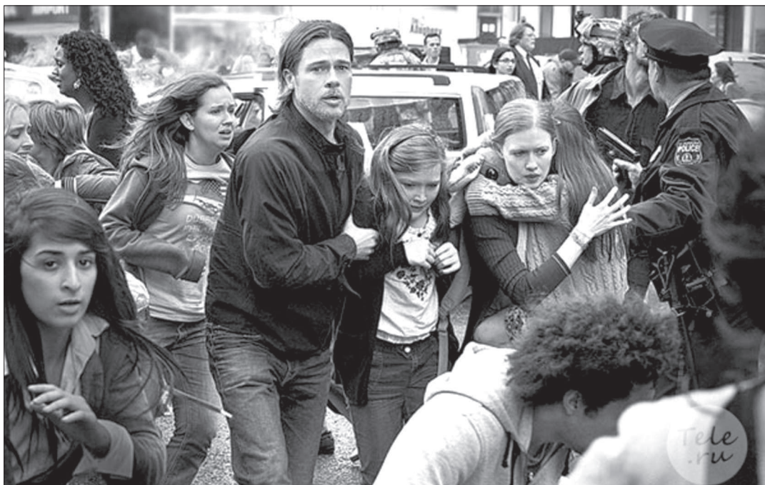
● Актриса массовки в фильме «Война миров Z» обязана Бреду Питту жизнью. Кадр из фильма.