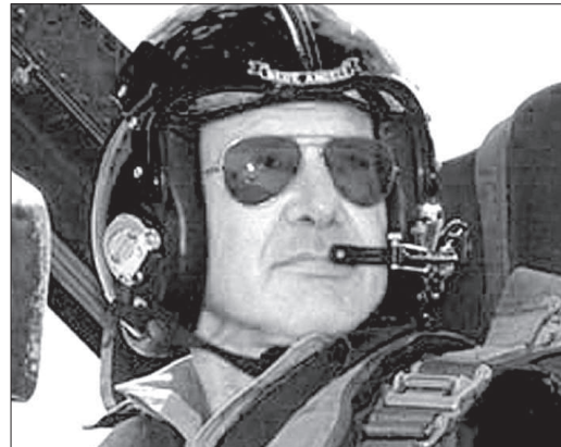
● Харрисон Форд на своем винтокрылом друге.