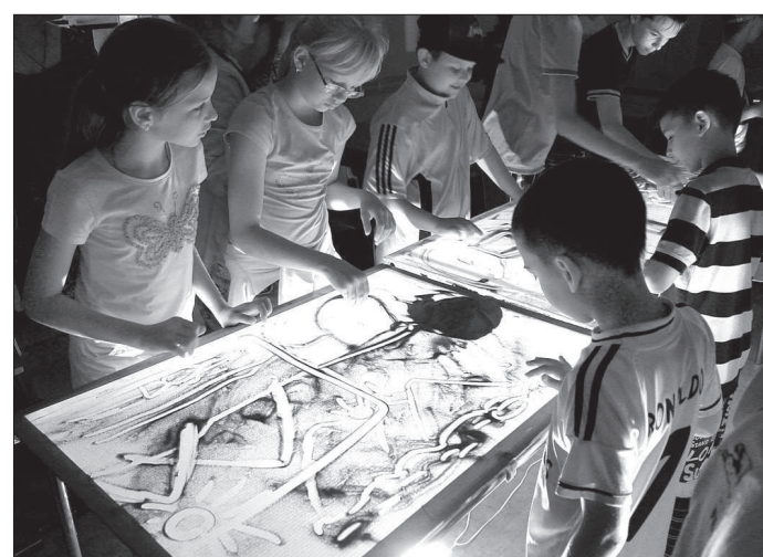
● Песочная анимация - это необычно!