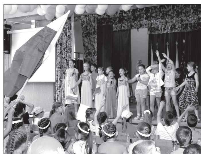
● В «Солнышке» в этот день проходил очередной праздник.

ПЕРВЫЙ пункт рейда - пришкольный лагерь «Солнышко», действующий при гимназии № 10 «ЛИК». Здесь отдыхают более ста детей. Игры, праздники, спортивные состязания - скучать ребятам некогда. А еще в лагере действует программа «Гора самоцветов». Ребята изучают историю России и обычаи, культуру населяющих ее народов. Даже отряды пришкольной дружины представляют те или иные регионы страны. Например, отряд № 5 называется... «Уральские вареники». Очень нравятся подопечным «Солнышка» экскурсии. Хлебобулочный, рыбхоз, конферма, пожарная часть - можно увидеть и узнать столько интересного! Так отдыхают школьники сегодня. Впрочем, пользуетесь случаем, журналисты поинтересо-