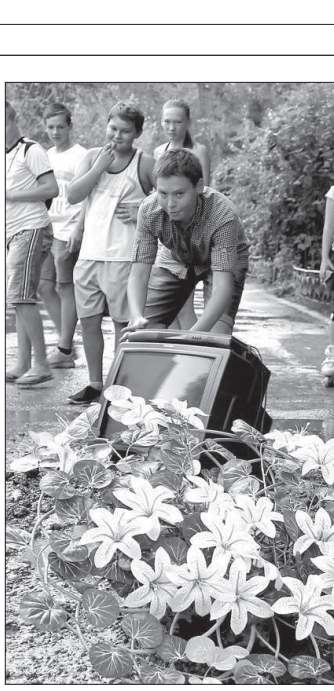
АЛЕКСАНДР МАЩЕНКО. Фото автора.