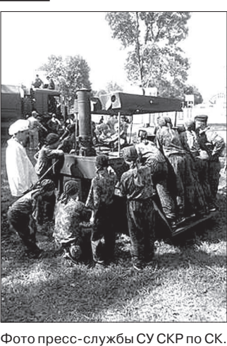
В. ЛЕЗВИНА.

Учащиеся кадетских классов под патронажем Следственного комитета РФ принимают участие в Российско-Абхазском военно-патриотическом слете «Азбука безопасности и выживания - 2014». Слет проходит с 15 по 28 августа на территории 7-й Российской военной базы в Абхазии, сообщила пресс-служба СУ СКР по краю. Программа включает комплекс обучающих дисциплин, стрельковую, высотную подготовку, курсы.