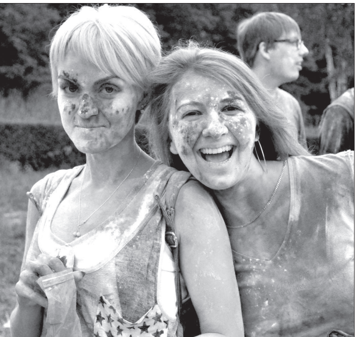
Особенно понравилось, когда в толпу распыляли краску из специальных баллонов...