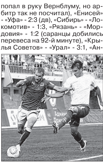
попал в руку Вернблуму, но арбитр так не посчитал.

ников, А. Кержаков, К. Панченко, Д. Полоз и Д. Черышев.