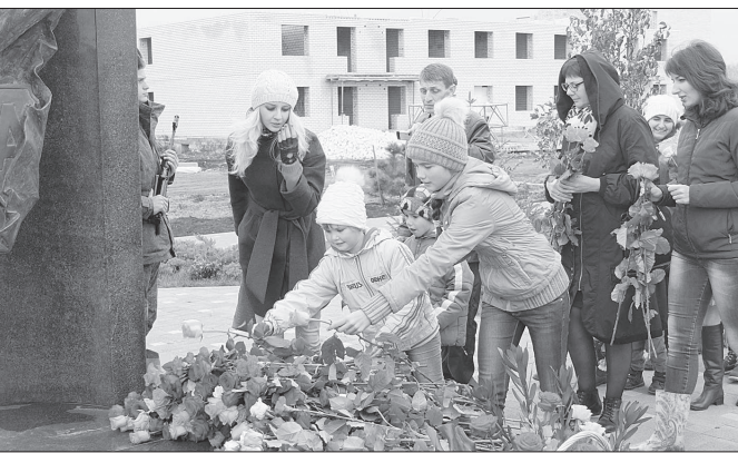
Воспитанники Севастопольского и Ставропольского президентских кадетских училищ, кадетской школы имени генерала Ермолова, воины-ополченцы Луганской народной республики, жители Михайловска возложили цветы к памятнику адмиралу Угрюмову и посадили около 2000 саженцев разных видов деревьев, 1784 из них символизируют год основания Михайловска.