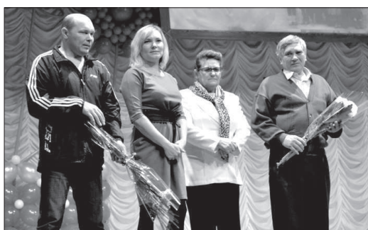
опору в лице сильного мужчины.

Что главное в воспитании детей? Как сохранить семейные ценности? Кому, как не родителям пятерых детей и по совместительству бабушке и дедушке десятых внуков, знать ответы на эти вопросы.