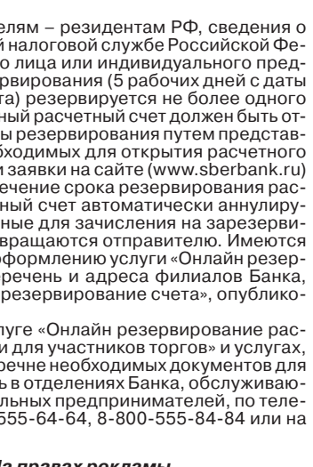
ОАО «Сбербанк России». Генеральная лицензия Банка России № 1481 от 08.08.2012. На правах рекламы.