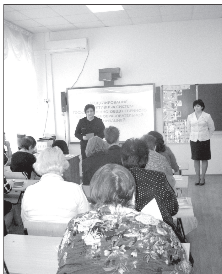
• Насыщенно прошел день стажеров в СШ №1 села Грачевка.

Корреспондент «Ставропольской правды» вместе со слушателями курсов побывал на двух базовых стажировочных площадках и познакомился с тем, как построено обучение.