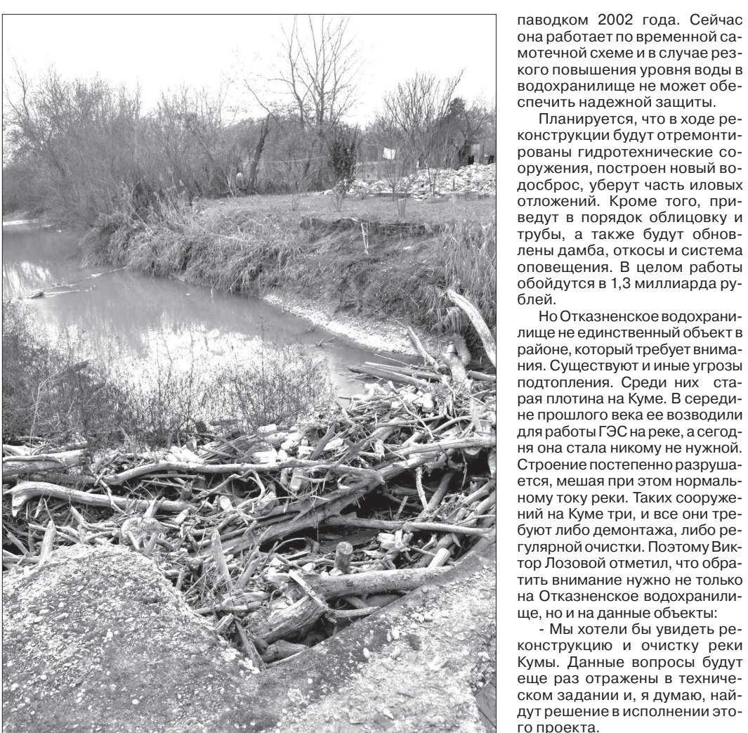
Старая плотина на реке Куме. ТАТЬЯНА ЧЕРНОВА. Фото автора.