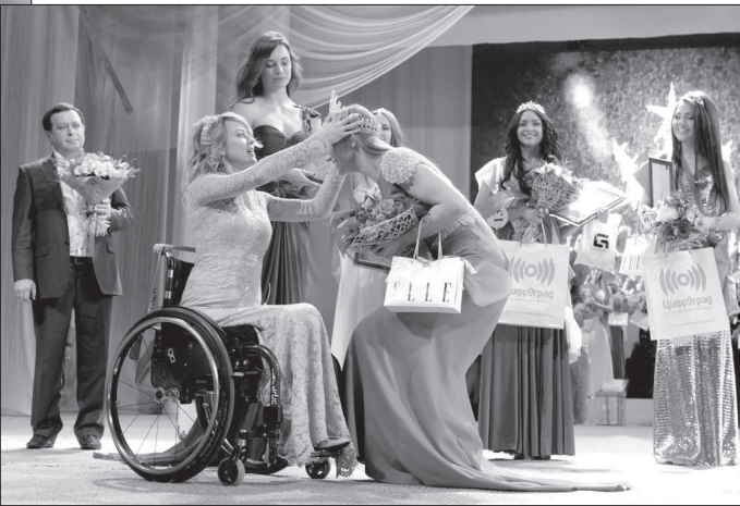
• Церемония передачи короны.