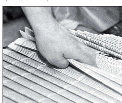
• Интернет - хорошо, а руки по-прежнему тянутся к печатному слову.

Среди десяти лауреатов есть и представители местной печати. Самая высокая награда России в медиаотрасли присуждена редакции общественно-политической газеты Успенского района Краснодарского края «Рассвет» за реализацию