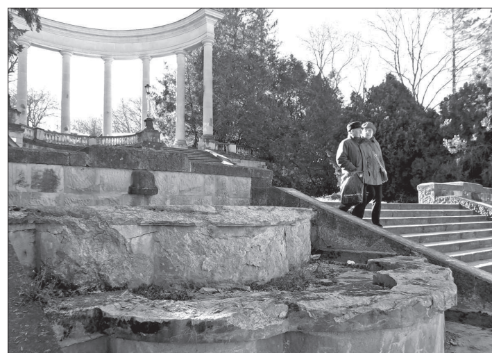
• Каскадная лестница.

Как уже сообщалось, на заседании общественного совета при Росимущество по Кисловодскому курортному лечебному парку, прошедшем в конце минувшего года, развернулась острая дискуссия по поводу намерения включить Кисловодский парк в состав Сочинского национального парка. Корреспондент «СП» выслушал доводы представителей муниципальных и федеральных властей.