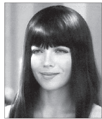
• «У самого Черного моря» (1975)

тию. Дело в том, что мой старший брат был главным инженером лестропхоза, и ему, поскольку должность обязывала, пришлось вступить в партию. Он подал заявление, а на собрании выяснилось, что он сын кулака, и ему отказали. Для брата это был сильный удар. И мой папа боялся, что мне предстоит пережить то же самое, что пережил мой брат. Он боялся, что мне придется страдать за его прошлое! - Я заметил, что многие актеры вашего поколения часто ходят в церковь. С чем это связано? - Наверное, это душевная потребность. Меня радует, что сейчас в храмах много молодежи, много мужчин с детьми. Думаю, что они искренне веруют. Если для нашего поколения вера - это избавление от душевной депрессии, то для них, мне кажется, это более осознанно. - Что вам дает вера? - Твердость. Только вера может дать твердость в жизни. - А работа и семья не дают ее? - При вере все дает твердость, без нее все зыбко.