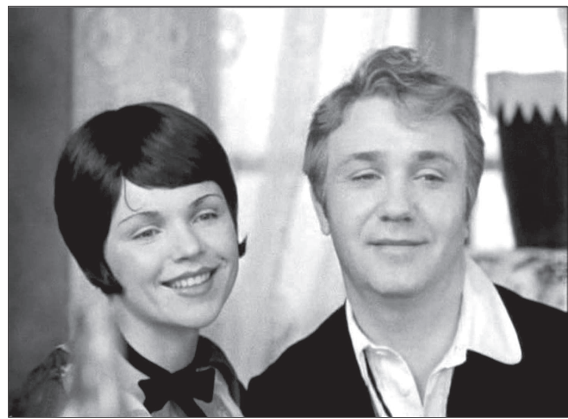
• «Не может быть» (1975)

вет, который он мне дал. Но почему не надо вступать, я не стала спрашивать. - Разве наличие партбилета не улучшало жизни артистов? - Ходили разговоры, что многие вступают в партию, чтобы роли получали. Но мне их и так предлагали, без членства в партии. Никто не подвергал сомнению то, что я актриса. Через одну знакомую мне дважды предлагали вступить в партию, но я сказала, что морально не готова. Я и тогда в церковь ходила, зачем мне была нужна партия? Что касается папы, то я никогда не подвергала сомнению то, что он делал, даже когда узнала, что папа был кулаком. Мне было очень тяжело, когда я узнала это, - сказывалось советское воспитание. Но поскольку я никогда не ставила его человеческие качества под сомнение и папа был для меня самым лучшим человеком в жизни, то внутренне я сформировала для себя свое отношение так: «Если папа был кулаком, значит, кулаки были хорошие люди». Если же говорить об открытости, то вот с тех пор я замолчала. Слуста какое-то время мой старший брат рассказал мне, почему папа так беспокоился, что я подам заявление в пар-