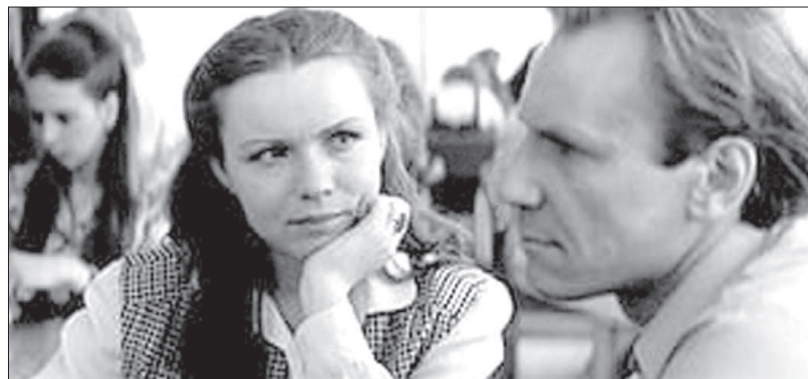
• «Портрет жены художника» (1981)