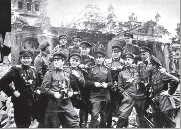
Военные фотографии у стен поверженного Рейхстага. Берлин, 1945 год.