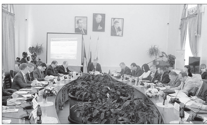
• Выездное заседание комитета Думы СК прошло в зале администрации Эссентуков.