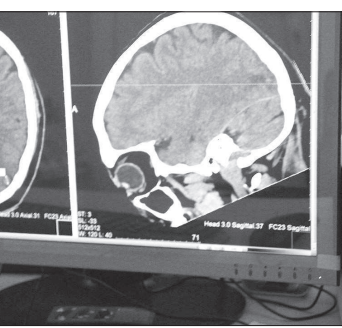
• Точный диагноз помогает поставить современное оборудование.