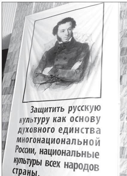
Под портретом Пушкина цитата из программы КПРФ.