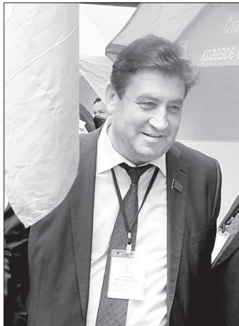
Председатель оргкомитета фестиваля депутат ГДРФ Виктор Гончаров.

Как мы уже сообщали, в Пятигорске под эгидой фракции КПРФ в Государственной Думе России и в Думе Ставропольского края прошел традиционный фестиваль «Пушкинские дни на Северном Кавказе», приуроченный к 216-летию со дня рождения Александра Пушкина.