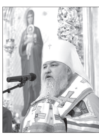
В эти дни по всему Ставрополю проходят различные акции, посвященные князю Владимиру, - выставки в музеях, концерты духовной музыки, творческие встречи. Так, в Ессентукской городской библиотеке имени С.Я. Маршала прошла встреча для школьников города, которые услышали рассказ о Крестителе Руси, после чего состоялся просмотр мультимедийного фильма о князе Владимире, о том, как из грубого язычника рождается Владимир Красно Солнышко, который и сегодня для всех нас, живущих в XXI веке, являет пример мудрого политика, блестящего полководца, настоящего христианина. А в Пятигорском краеведческом музее открылась выставка «Святая равноапостольная князь Владимир - Креститель Руси». Экспозиция знакомит зрителя с раними христианскими святянами из собрания музея, кроме того в нее включены рисунки и поделки воспитанников воскресных школ Пятигорского благочиния.

нском кафедральном соборе краевой столицы будет открыт до 22 июля.