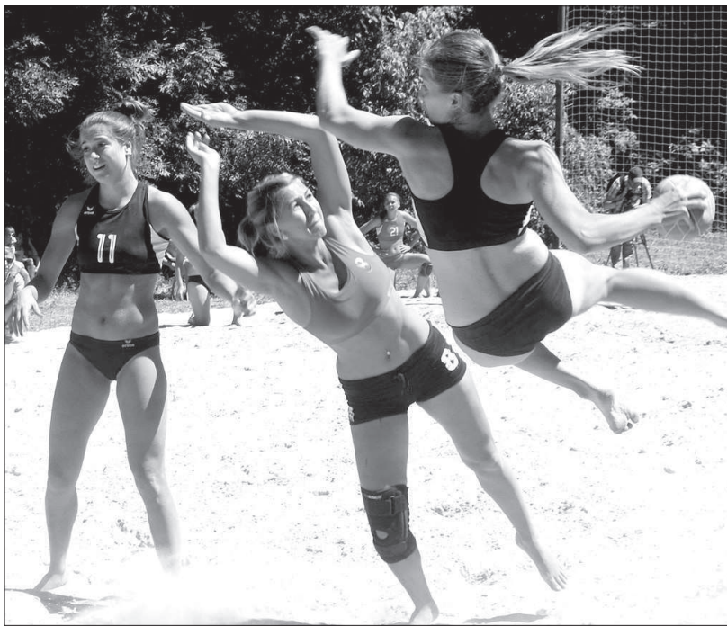
Момент финальной встречи команд «Ставрополье-СКФУ» и «СДЮШОР-КГАУ» (Краснодар).