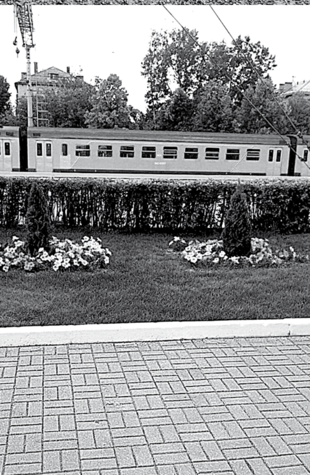
Глядя на эти фотоснимки, которые В. Овчинников приложил к своему письму, совсем не трудно установить, где запечатлены привокзальные красоты Невинномысска, а где, как пишет автор, «обычная станция по дороге в Москву».

рогу, остается по факту практически бесхозной.