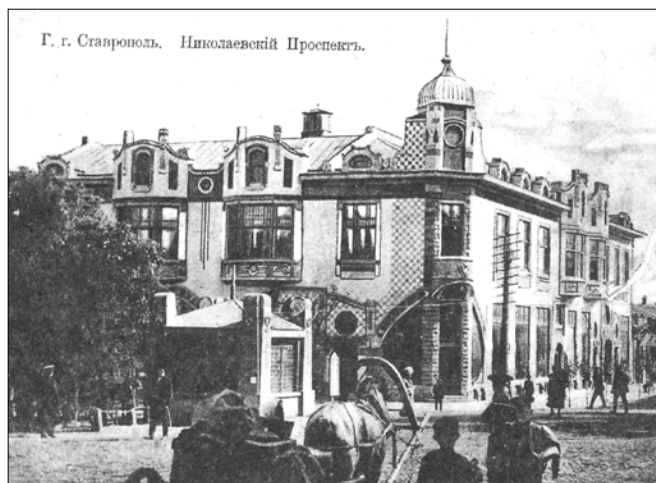
Г. г. Ставрополь. Николаевский Проспект.