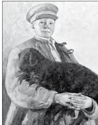
образный манифест стойкости человеческого духа.

Надо сказать, что художник не любил вспоминать о днях заключения, и этот период не нашел отражения в его творчестве. Наоборот, каждая работа наполнена светом и жизнью. Например, в пейзажах он тонко чувствовал природу, ее силу