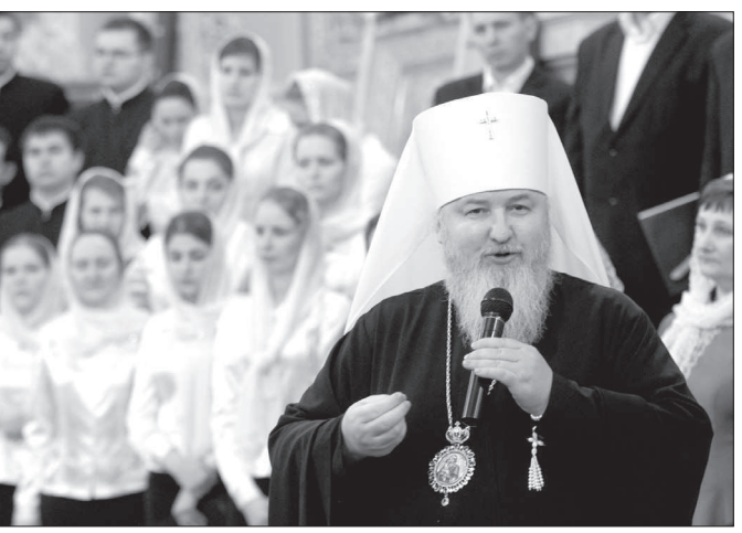
зняка. Они исполнили колядку «Добрый вечер тобі» на украинском языке.

В заключение владыка поблагодарил всех участников за праздник духовной музыки