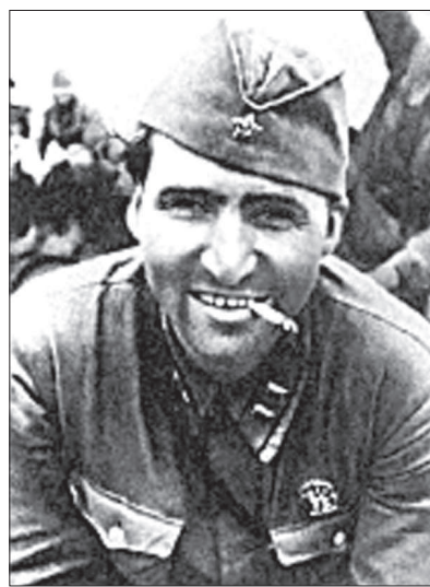
Стантин видел свой долг в том, что бы свое литературное творчество