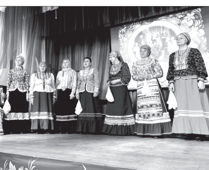
Ансамбль народной песни «Лада».

Зрители убедились в этом, когда ансамбль затянул задуманную «Как во чистом поле». Гости праздника стали непосредственными его участниками — вместе с артистами они водили хоры, стараясь подхватывать слова на припеве.