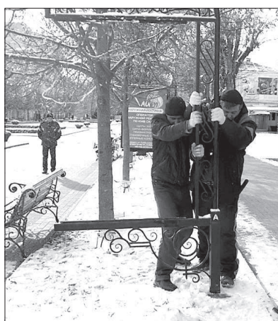
На Курортном бульваре под корень сносят и остовы рекламных конструкций.

На днях на Курортном бульваре Кисловодска, напротив здания Главных нарзанных ванн, демонтировали два десятка рекламных конструкций двухметровой высоты.