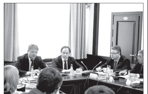
Совещание в правительстве края по развитию агропромышленного комплекса.

Питр Чекамурев напомнил о стратегических задачах, стоящих перед отечественным сельхозхозяйственным комплексом. Одна из основных - увеличение к 2030 году объемов производства зерна до 130 миллионов тонн в год, то есть почти на треть. Это потребует повышения эффективности зернового производства, а применительно к Северному Кавказу - увеличения средней урожайности как минимум на 5 центнеров с гектара.