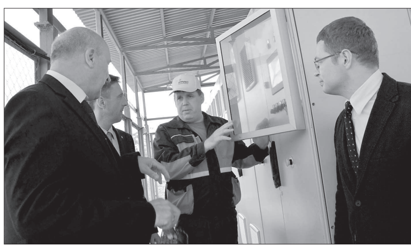
• Еще минута - и будет торжественно запущена новая насосная станция.

обеспечить степняков местной витаминной продукцией.