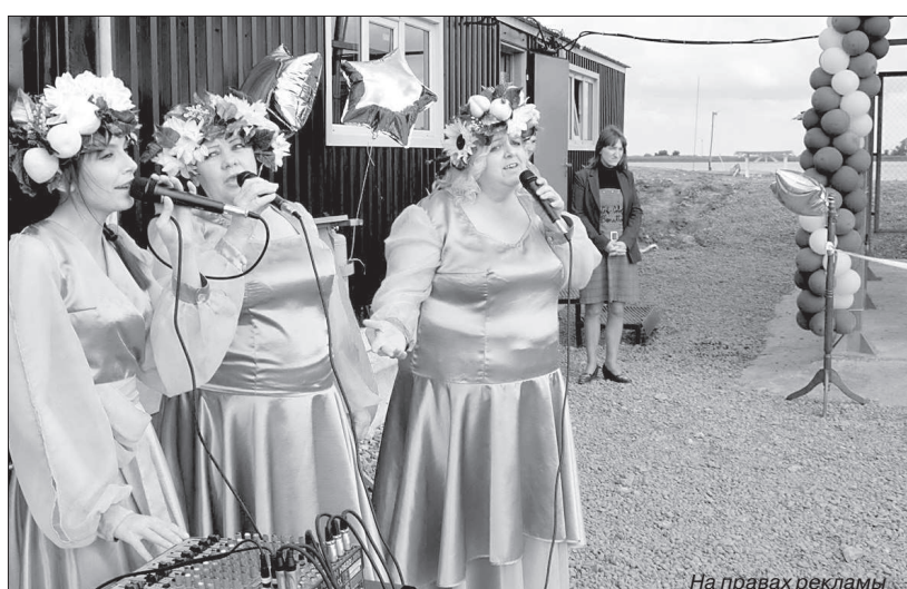
• Участники художественной самодеятельности села Малая Джалга украсили праздник своими песнями.