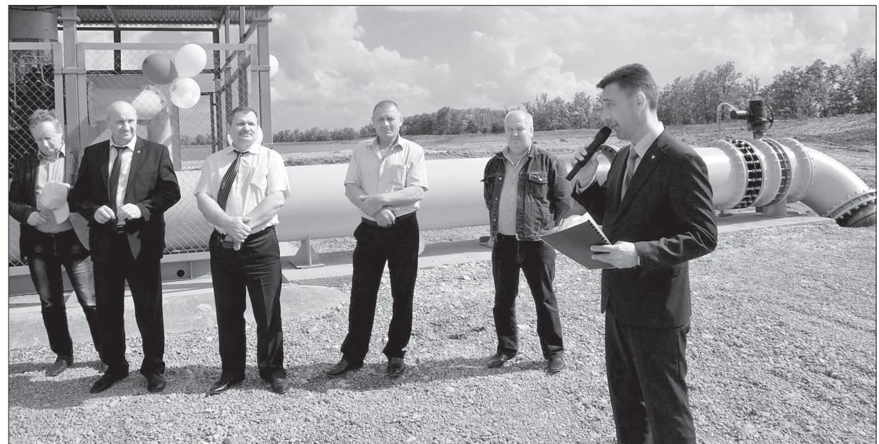
• Поздравление от первого заместителя министра сельского хозяйства СК Алексея Руденко.

Запущенные в 2013-2014 годах насосные станции в СХП «Агроинвест» - это современная американская технология, полностью автоматизированные круговые стационарные системы орошения.