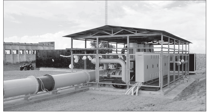
• Новая насосная станция – предмет гордости апанасенковцев.