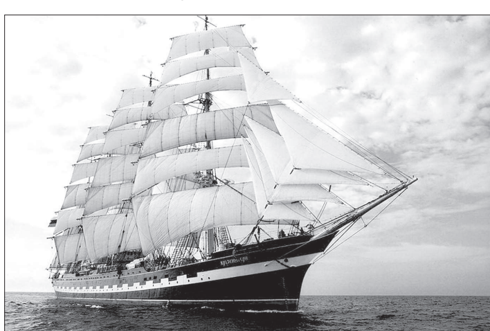
АРД МИД РФ присвоила барку «Крузенштерн» звание «Посланник мира».

важнее всего на свете, ответ будет один: самое главное – чтобы не было войны, на которую призывают сыновей. Поэтому лучшие представители молодежи, прошедшие конкурс на право участвовать в проекте «Дипломатия под парусами», станут посланцами мира в этом турне. Им пред-