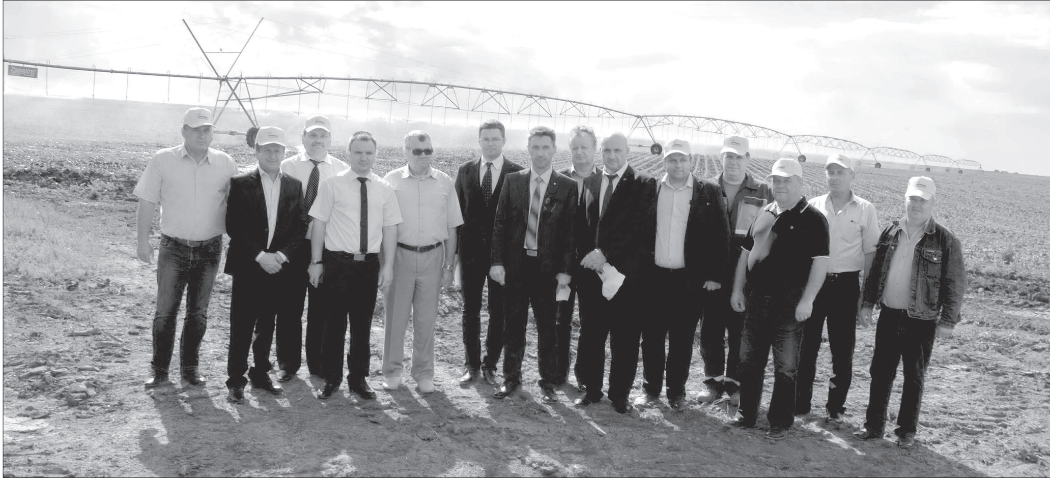
• Фотография на память на фоне, о котором можно только мечтать. Последнее орошение здешние поля получали в 2003 году, и никто не мог предположить, что счастье рукотворного дождя вновь станет возможным в Малой Джалге.

В селе Малая Джалга Апанасенковского района произошло событие, о котором здесь даже и не мечтали: в местное сельскохозяйственное предприятие ООО СП «Джалга» пришло орошение