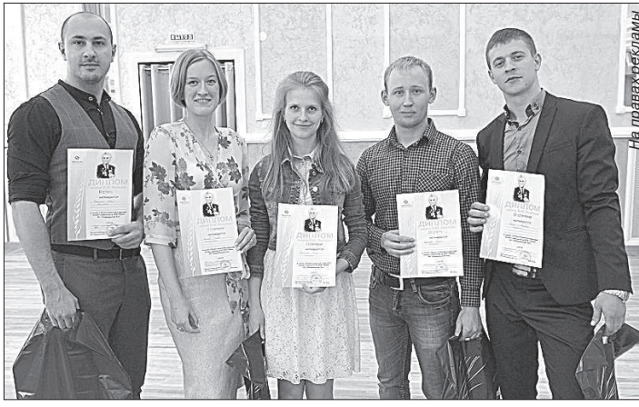
Победители научно-технической конференции молодых специалистов АО «Невинномысский Азот».

Ежегодно в канун Дня химика проходит научно-техническая конференция (НТК) молодых специалистов АО «Невинномысский Азот».