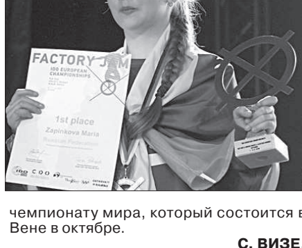
чемпионату мира, который состоится в Вене в октябре.

наши танцоры опередили более 70 пар и вышли в финал, где заняли достойное четвертое место, и также получили медали от организаторов.