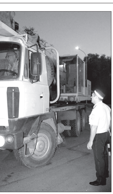
А. МАЩЕНКО. Фото автора.