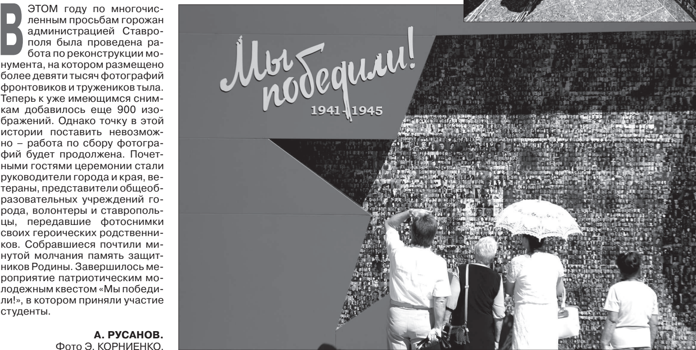
А. РУСАНОВ.

Племенные хозяйства Ставрополя расширяют географию поставок своей продукции, в том числе и за рубеж.