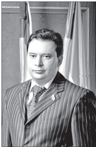
Подготовила Ю. ПЛАТОНОВА.

Несколько слов о личном отношении к происходящему. Я всегда придерживался позиции, что практически любые шаги в направлении декриминализации УК несут положительный заряд. Ведь, к сожалению, действительно такова, что уголовное нака-