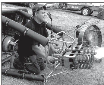
Пламя мощных газовых горелок наполняет шары горячим воздухом.

ными лазерными выстрелами. Попадание фиксируют специальные датчики. Виталий Ненашев особо отмечает: - Лазерные ружья, которые мы используем в воздушном биатлоне, пензенские, АТ-программы тоже отечественные.