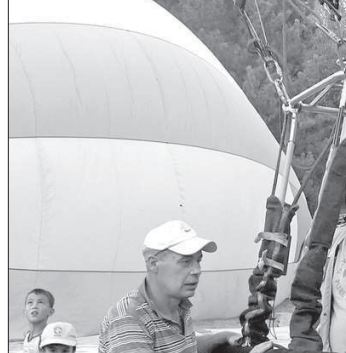
В корзине каждого аэростата есть человек с лазерной винтовкой.