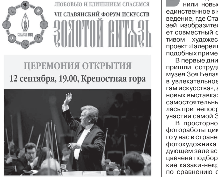
Концерт Государственного академического ансамбля народного артиста СССР В.И. Федосеева с участием народного артиста России П.И. Бурляева

12-17 СЕНТЯБРЯ 2016 ГОДА, СТАВРОПОЛЬСКИЙ КРАЙ ЛЮБОВЬЮ И ЕДИНЕНИЕМ СПАСЕМСЯ VII СЛАВЯНСКИЙ ФОРУМ ИСКУССТВ «ЗОЛОТОЙ ВИТЯЗЬ» ЦЕРЕМОНИЯ ОТКРЫТИЯ 12 сентября, 19.00, Крепостная гора