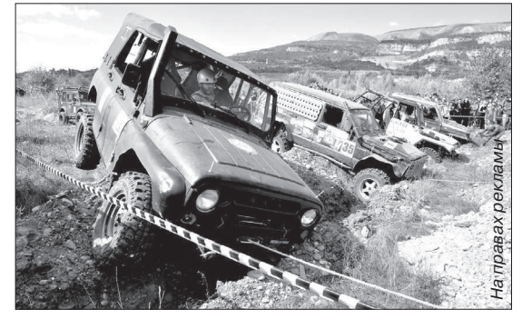
Соревнования по трофи-спринту на кубок ФНПР не оставили болельщиков равнодушными.

ЛЮДМИЛА КОВАЛЕВСКАЯ. При содействии пресс-службы ФПСК.