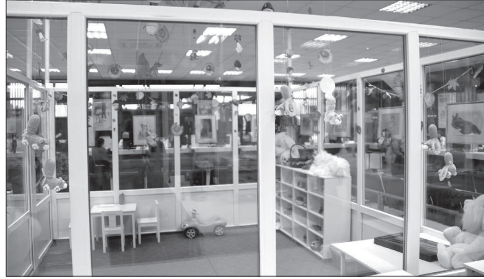
• Детская комната МФЦ Невинномысска.

Что необходимо для организации масштабной акции, направленной на помощь тяжелобольным детям? Кто-то скажет: нужны деньги. Требуется поддержка чиновников, возразит другой. Необходимо широкое информирование населения, добавит третий. Каждый будет прав, но... не совсем. Перво-наперво необходимо живое участие неравнодушных людей, для которых чужой беды не бывает. Только так рождаются идеи и дела, дающие реальный эффект.