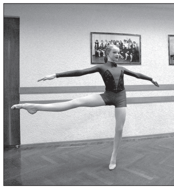
- За короткое время фестиваль стал неотъемлемой частью культурной жизни Ставрополя. Замечательно, что в нашем городе существует такой яркий проект, обращенный к самой широкой аудитории. А особенно приятно видеть, как много у нас талантливых ребят, - отметил глава Ставрополя Андрей Джатдоев.

Оценивали мастерство участников лучшие хореографы и балетмейстеры Юга России, Москвы и Луганска. В итоге Гран-при и главный приз - кубок главы администрации города Ставрополя получили учащиеся образцового танцевального коллектива «Грация» СДТ. Еще два кубка уехали в Изобильный и Майкоп.