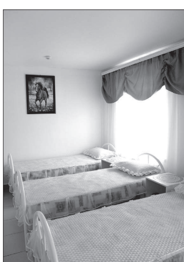
санаторий. Не зря же сюда и взрослые тахтинцы идут полюбоваться, и школьники, и детсадовцы на экскурсию приходят.

А ведь обустроить пришлось почти пятнадцать гектаров. И в каждом уголке появилось что-то новое, не повторяющееся. Дизайнерами были сами сотрудники, они превратили всю огромную территорию в цветущий сад или, как говорят гости и родственники постояльцев, в