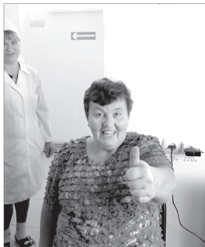
• Такой ремонт новоселам нравится!

тельства понравилось. Кроме мебели купили аудио- и видеоаппаратуру, обустроили уголки досуга.