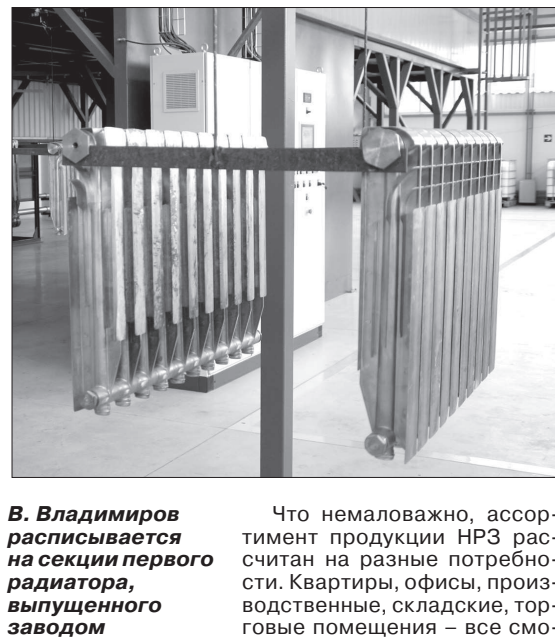
В. Владимиров расписывается на секции первого радиатора, выпущенного заводом

Что немаловажно, ассортимент продукции НРЗ рассчитан на разные потребности. Квартыры, офисы, производственные, складские, торговые помещения - все смогут найти продукцию под свои запросы. В три федеральных округа начнутся первые поставки радиаторов под маркой «Сделано на Ставрополье».