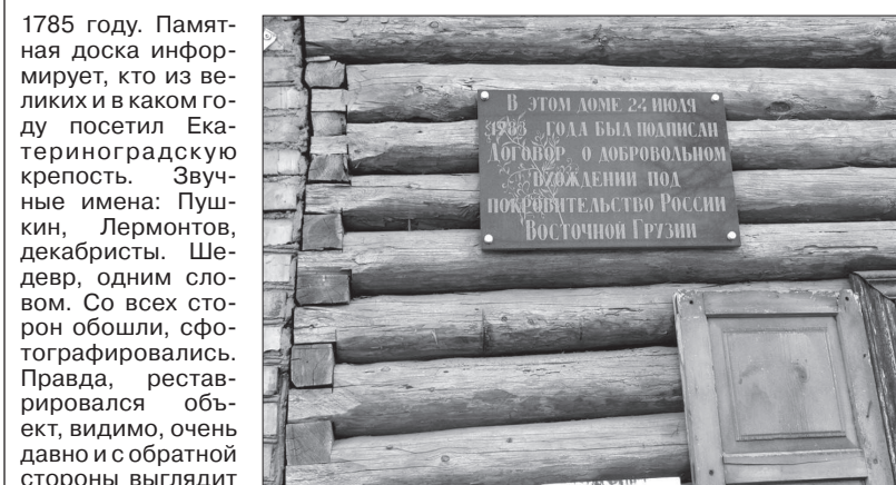
Дом, в котором в 1783 году был подписан Георгиевский трактат.