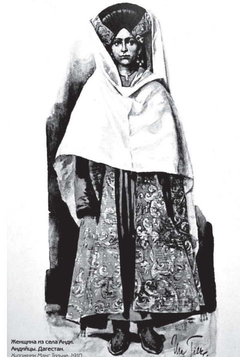
Изображение из сада Артур Артурович Дегестан. Художник Макс Тильке, 1910.