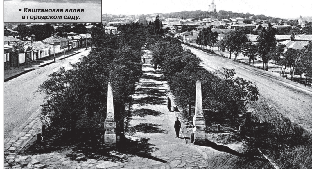
• Городской бульвар у Тифлиских ворот.