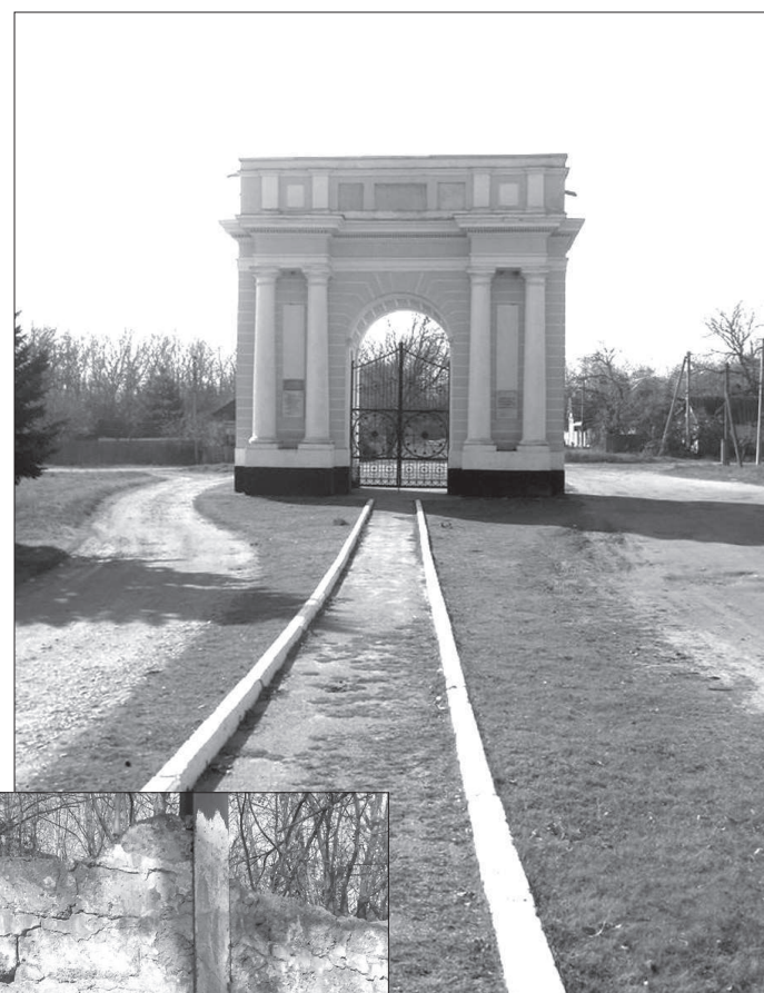
Триумфальная арка в Екатериноградской.

Крепость номер один на линии - Екатериноградская (это в Кабардино-Балкарской Республике), Роскошная триумфальная арка - архитектурный памятник, возведенный в