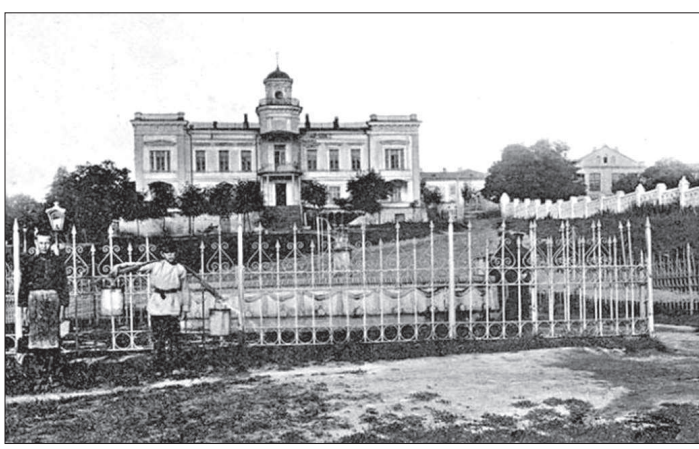
• Здание Ставропольской городской думы.