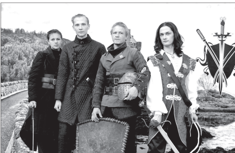
Основатели клуба в реконструированных исторических костюмах.

В Ставрополе появился необычный клуб исторического фехтования «Спутник»