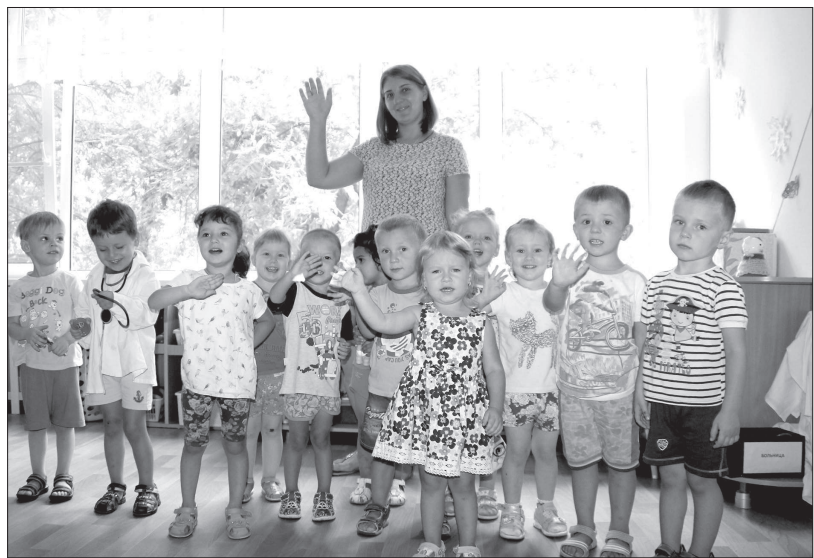
Ребята детсада «Светофорик», как и малыши из семи других садов Невинномыска, рады уюту и комфорту в обновленных группах.

В Невинномыске благодаря поддержке краевого правительства успешно реализуется программа замены старых окон в школах и детских садах