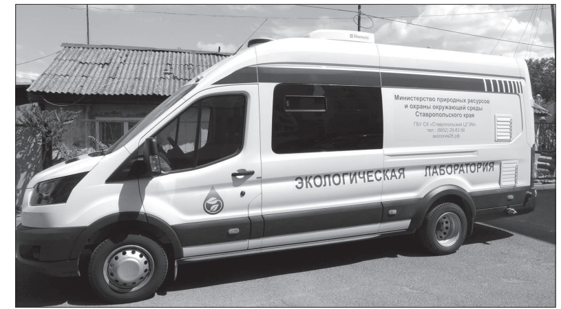
• Так выглядит передвижная эколаборатория.

На Ставрополе большое внимание уделяется охране окружающей среды, в том числе атмосферного воздуха. Ведь это важнейший залог здорового образа жизни. В рамках краевой природоохранной программы начала свою работу передвижная эколаборатория.