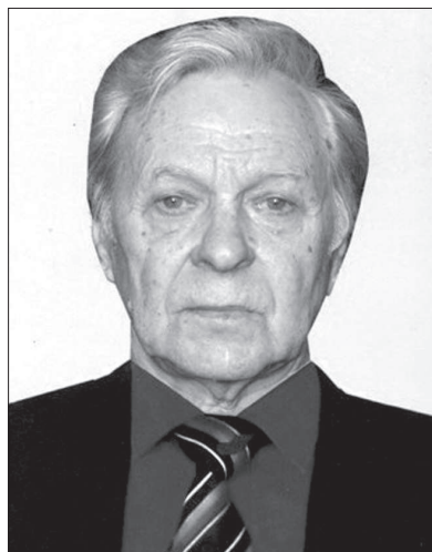
С. ВИЗЕ.

Н А протяжении двух десятков лет наш земляк был действующим спортсменом, одним из сильнейших легкоатлетов Ставрополья, удачно выступавшим на республиканских и всесоюзных соревнованиях. Краевые рекорды Орлянского в беге на короткие дистанции и прыжках в длину незлыблемо стояли десятки лет.