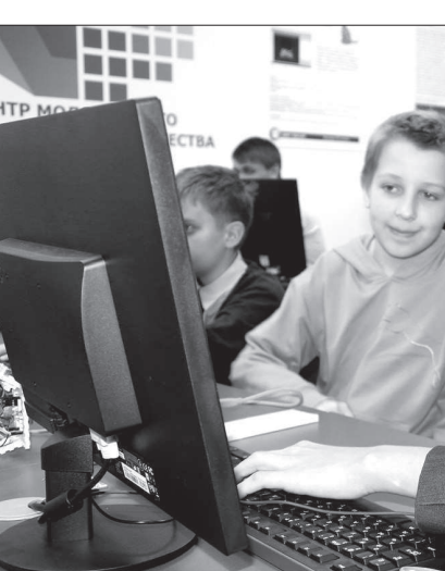
В центре «Квазар» уже сегодня можно выбрать профессию будущего.

созданной в крае многоступенчатой системы подготовки квалифицированных рабочих, инженерных кадров для города и села. Здесь также вскоре стартуют различные конференции, семинары, рабочие встречи.