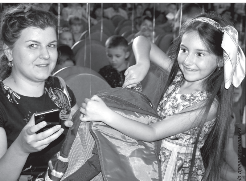
Дети счастливы, родители довольны - такая атмосфера царит во время вручения первоКЛАССНЫХ подарков.

Дети, а также их родители заполнили украшенный воздушными шарами зал Дворца культуры химиков, в котором перед вручением подарков прошло большое яркое шоу. Кстати отметим, два года назад «храм культуры» про-