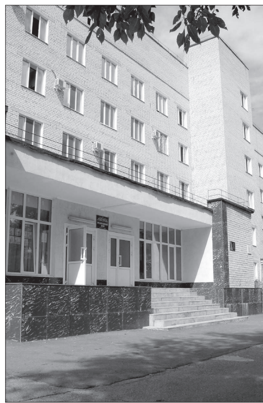
В роддоме Невинномысска за год появится на свет около 2 тысяч малышей.

На необходимые работы из краевого бюджета направлено 20 миллионов рублей. По результатам конкурсных процедур стоимость капитального ремонта объекта снизилась до 18 миллионов 950 тысяч рублей.