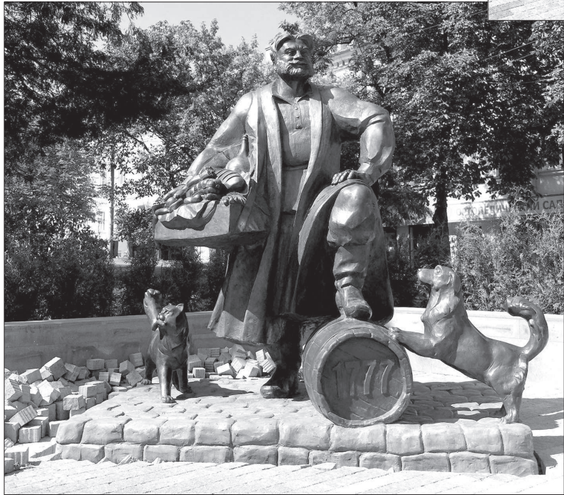
• Ставрополь, проспект К. Маркса.

ОРОДОМ-САДОМ с цветущими не только яблонями Ставрополь был всегда. И к празднованию 240-летнего юбилея здесь отнеслись со всем необходимым пietetом. В соответствии с федеральным проектом на Юго-Западе открылся музейно-выставочный комплекс «Россия - моя история». Облагородился сквером с фонтанами центральный, 53-й квартал столицы края. А на пересечении проспекта Карла Маркса (Ермоловского бульвара) с улицей Голенева установлены так называемые беседки счастья. Этот арт-объект выполнен в виде лавочек, которые укрывают зонты, образуя таким образом лавочки-беседки. К слову, весьма стильно и симпатично. Этот полет креативной фантазии «облагораживальщиков» города не ограничился. Времена сейчас в каком-то смысле новые, а в каком-то хорошо забытые старые. Поэтому напротив лавочек установили статуи купца по проекту известного ростовского скульптора Дмитрия Лындина. Все бы ничего, но вот загвоздка: почему-то памятник этот хотя и не как две капли воды, но весьма сильно похож на аналогичный, установленный