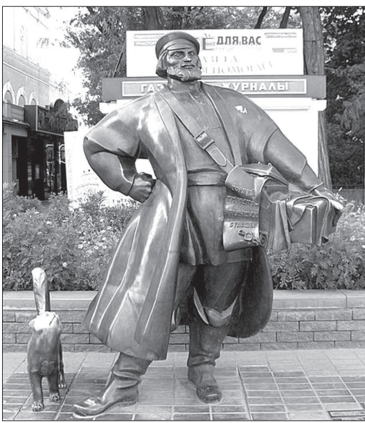
• Ростов-на-Дону, улица Большая Садовая.

ОРОДОМ-САДОМ с цветущими не только яблонями Ставрополь был всегда. И к празднованию 240-летнего юбилея здесь отнеслись со всем необходимым пietetом. В соответствии с федеральным проектом на Юго-Западе открылся музейно-выставочный комплекс «Россия - моя история». Облагородился сквером с фонтанами центральный, 53-й квартал столицы края. А на пересечении проспекта Карла Маркса (Ермоловского бульвара) с улицей Голенева установлены так называемые беседки счастья. Этот арт-объект выполнен в виде лавочек, которые укрывают зонты, образуя таким образом лавочки-беседки. К слову, весьма стильно и симпатично. Этот полет креативной фантазии «облагораживальщиков» города не ограничился. Времена сейчас в каком-то смысле новые, а в каком-то хорошо забытые старые. Поэтому напротив лавочек установили статуи купца по проекту известного ростовского скульптора Дмитрия Лындина. Все бы ничего, но вот загвоздка: почему-то памятник этот хотя и не как две капли воды, но весьма сильно похож на аналогичный, установленный