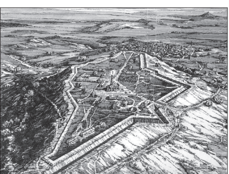
• Реконструкция Ставропольской крепости. 1778 год.

ЭКСПОЗИЦИЯ представляет предметы и документы, многообразно отражающие сложный процесс ее основания и развития, роль в становлении государственности на южных рубежах России. Уникальные находки из археологических раскопок на территории Крепостной горы Ставрополя, необычные предметные экспонаты, иллюстрации и фотографии, отражающие быт солдат и казаков, служивших на Кавказе, крестьян-переселенцев и городского населения региона конца XVIII - начала XX в., - все это ярко отражает судьбоносное для Кавказа появление мощного оборонительного пояса. Часть материалов для выставки предоставили музеи Георгиевска, Изобильного, Донского и Александровского.