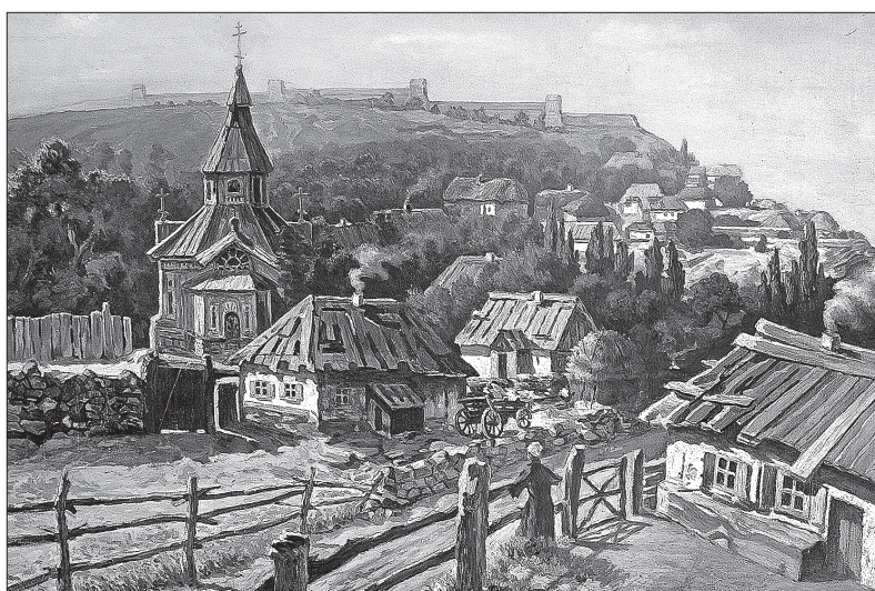
• Ставропольская станция. 1877 год.

Как известно, появление Азово-Моздокской оборонительной линии явилось одним из результатов победы в Русско-турецкой войне 1768 - 1774 годов, закончившейся разгромом хозяйничавших в регионе войск Османской империи. По Кючук-Кайнарджийскому мирному договору Крым был объявлен независимым от Турции, а русско-турецкая граница на Северном Кавказе стала проходить от устья Терека до Моздока и далее на северо-запад к Азову. Сформировать на новых южных рубежах империи мощные форпосты было поручено наместнику Астраханской, Азовской и Новороссийской губерний светлейшему князю Григорию Потемкину. По его приказу астраханский генерал-губернатор Иван Якович лично обследовал территорию между Азовом и Моздоком, составил план местности и внес предложения по устройству укрепления протяженностью около 500 километров. Прикрывая новую границу должны были кубанские, волжские и хоперские казаки. Весной 1777 года императрица Екатерина II утвердила проект «О создании Азово-Моздокской укреплен-