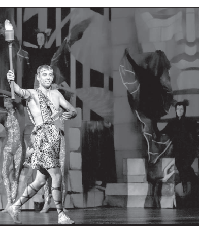
• Сцена из музыкальной сказки «Маугли» (В. Ремчуков).