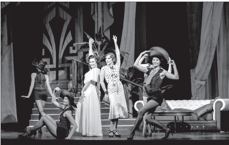
• Сцена из спектакля «Как вернуть мужа» (В. Ильин, В. Лукашов).

разделяли многие руководители театров, поскольку финансовые возможности небольшого города весьма скромные, а сохранить эти удивительные очаги провинциальной культуры - важная задача. И вот в 2014 году Президент Российской Федерации В.В. Путин выдвинул эти аспекты как главные, предвзятое появление программы поддержки малых городов в сфере культуры, центрами развития которой в значительной мере являются театры. Так что очень своевременно о нас вспомнили и обратили внимание. И очень важно, что это внимание стало в последние годы адресным.