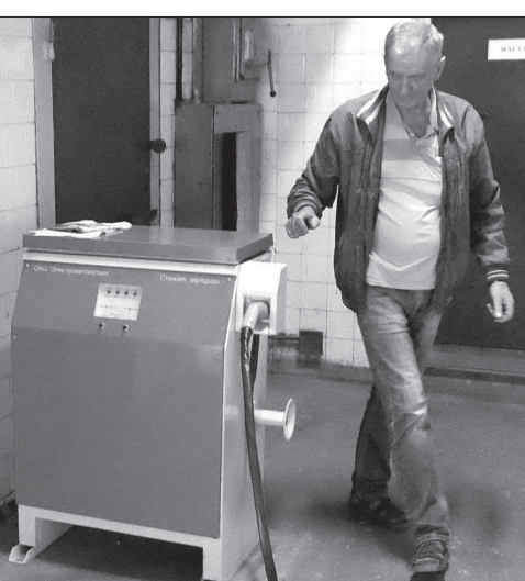
Для успешного внедрения электромобилей на Ставрополье повсеместно должны появиться вот такие «быстрые» зарядки.

В феврале 2013-го в Кисловодске прошла торжественная презентация первых пяти серийных электромобилей el-Lada, закупленных ЗАО «Автоколлонна 1721» для работы в качестве такси. Правительство края постаралось облегчить для кисловодского автопредприятия финансовое бремя: на каждый электромобиль давало субсидию в размере 350 тысяч рублей. Но даже при такой поддержке каждая el-Lada обходилась покупателю в 610 тысяч рублей – значительно дороже обычной «Калины», на базе которой она была изготовлена. Случай несколько месяцев на «АвтоВАЗе» подготовили к отправке в Кисловодск вторую партию электромоби-