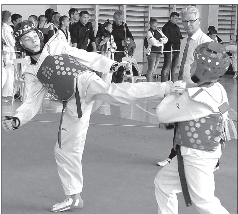
Просто они увидели в Интернет-сообщении о предстоящем турнире и позвонили. Я счел, что отказывать спортсменам, оказавшимся в сложной ситуации, будет неправильно. Поэтому ответил: «Если у вас есть возможность приехать, добро пожаловать!». И вот они вместе с нами.