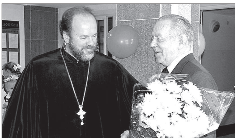
• Не забыли в этот день и о ветеранах педагогического труда.

В православной классической гимназии Невинномыска прошло чествование учителей.