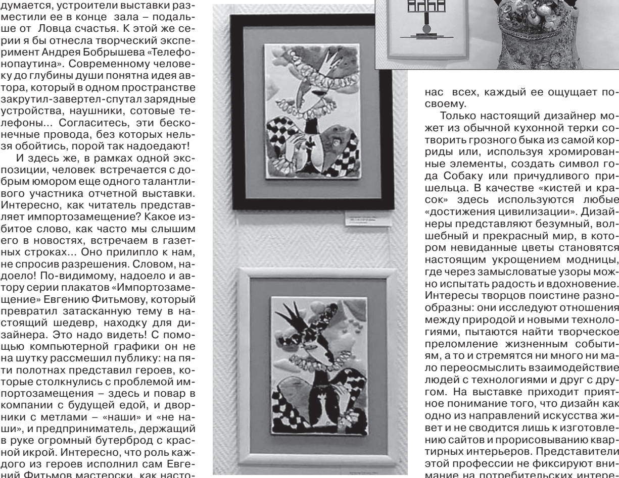
остановить человека, чтобы тот мог о чем-то подумать. Казалось бы, импортозамещение – скучная политическая тема. А с другой стороны, если ее проецировать на людей —