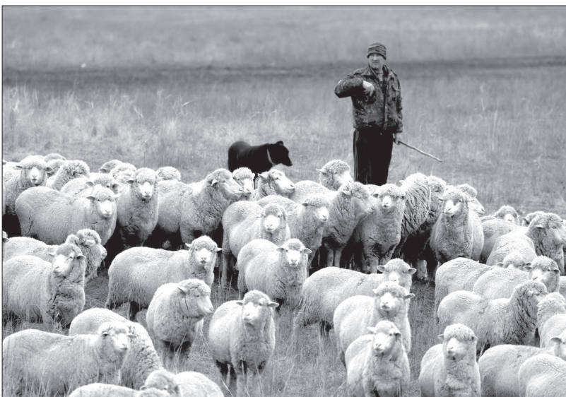
Еще одной темой пресс-тура стало положение дел в племенном овцеводстве. Ставрополье - один из немногих регионов страны, сохранивших это направление животноводства, являющееся маркой края. В колхозе-племзаводе «Маньч» создан селекционно-генетический центр по разведению овец породы маньчский меринос. Сейчас в хозяйстве готовятся к началу приема молодняка. Племенное стадо превышает 11 тысяч овец. В прошлом году реализовали почти 32 тонны шерсти, 88 тонн баранины. В нынешнем году думают получить не меньшие результаты.