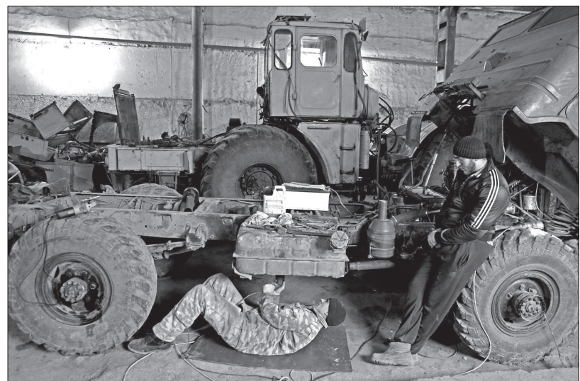
● В ремонтных мастерских в эти дни работа идет полным ходом.